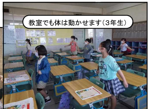
教室でも体は動かさず(3年生)