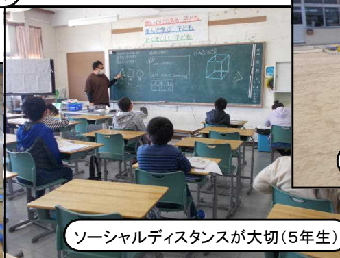
ソーシャルディスタンスが大切(5年生)