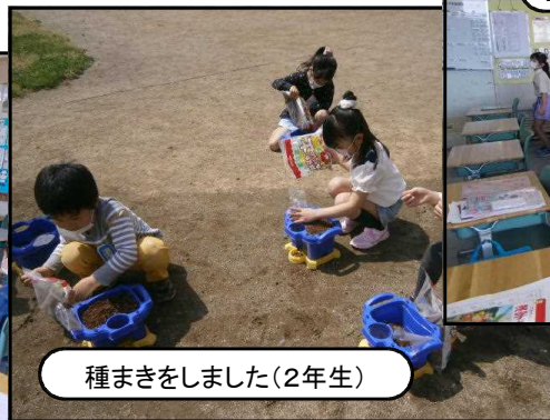
種まきをしました(2年生)