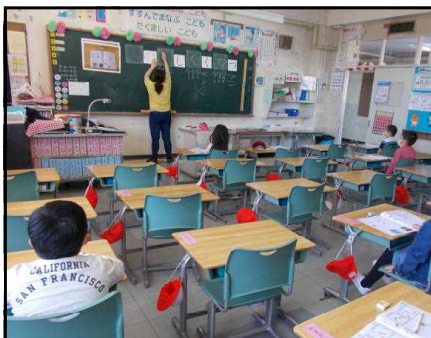
まずはひらがなのおべんきょう(1年生)

長い長い臨時休業が続いていましたが、ようやく、登米市では5月25日(月)に学校を再開することが決まりました。大変長らくお待たせいたしました。学校再開に向けて5月中旬は登校日を増やし、学校にいる時間も少し長くしました。「3密」を緩和するため、全校を地区ごとの2グループに分けて、半数ずつの登校ですが、それでもようやく学校らしさが戻ってきました。まずは、前の学年でやり残した内容の授業からです。でも、休み時間があります。体育もしました。子供たちのはしゃぐ声が学校に帰ってきました。もう少し、もう少しです。ここからまた感染が拡大してしまったら元も子もありません。どうかどうか、不要不急の外出を控え、命と健康と安全を守る最大限の行動をお願いいたします。