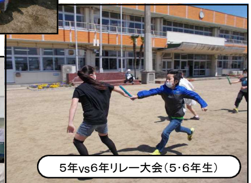
5年vs6年リレー大会(5・6年生)