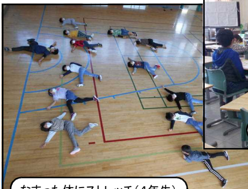
なまった体にストレッチ(4年生)