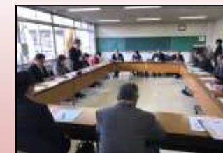
学校運営協議会より