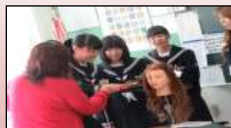
キャリアセミナーより