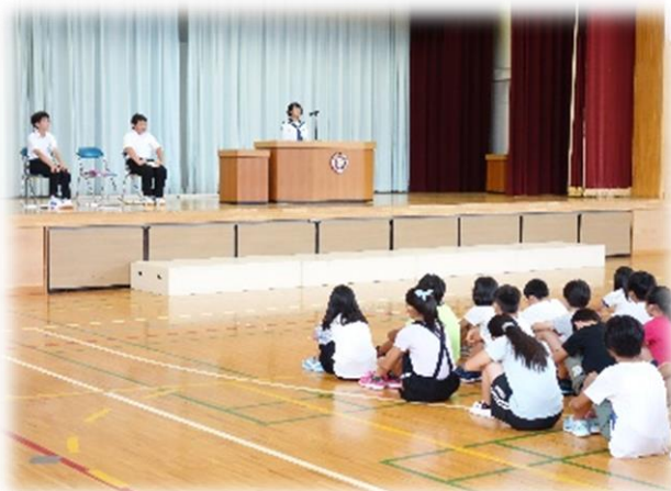
「英語弁論を聞く会」