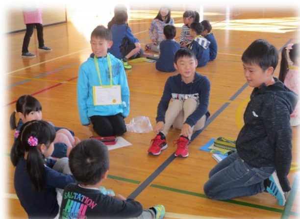
幼稚園の子どもたちが来校した「55交流」