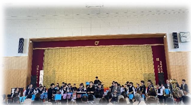
「まるごといしこまつり」での合同演奏

このほか、幼稚園・保育園との交流や、中学校での部活動体験等、園・学校間の交流も行われています。